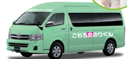
■デマンド(予約)型相乗りタクシー